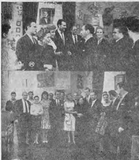
Artistas de la Compañía Española visitaron en su residencia a don José Figueres y a su gentil señora esposa.