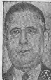
DE GAULLE... Francia contará con fuerza nuclear considerable...

● PARIS, 26 (AP)—El Presidente De Gaulle obtuvo finalmente hoy la aprobación parlamentaria para sus planes en favor de una fuerza francesa de ataque nuclear.