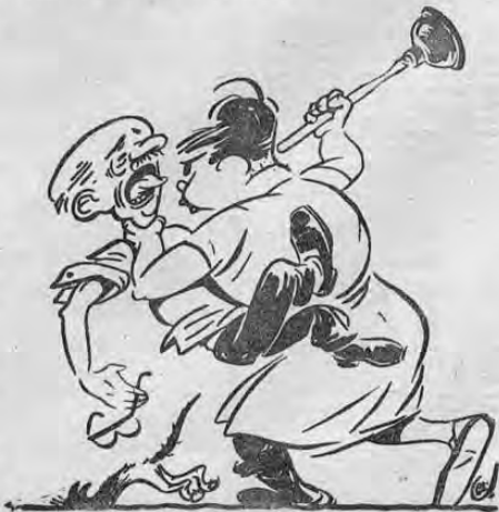
Nuevo y colorístico deporte familiar auspiciado por la Sala Delmora Civil de la Corte Suprema de Justicia