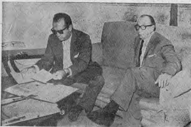
Momentos después de haber llegado de los Estados Unidos, el Canciller Lic. Oduber Quiros, hacia entrega en la Casa Presidencial, al Presi-