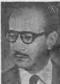
Presidente VILLEDA MORALES... los comunistas se mueven en Honduras...

● WASHINGTON, 26 (AP)— Planes de un complot comunista para apoderarse de Honduras se encuentran en estudio por una Comisión Especial de la Organización de Estados Americanos sobre seguridad continental.