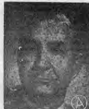
FIGUERES...dicitó interesante conferencia...

● SAN JOSE, COSTA RICA, 26 (AP).—El ex presidente José Figueres informó que asistirá a la segunda conferencia mundial sobre "tensiones que retardan el desarrollo en América", que se efectuará en Salvador, Brasil, del 6 al 19 de agosto.