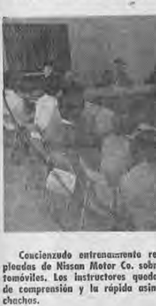
Concluzado entrenamiento recibe un numeroso grupo de empleadas de Nissán Motor Co. sobre la técnica de las ventas de automóviles. Los instructores quedaron maravillados del alto nivel de comprensión y la rápida asimilación que muestran estas muchachas.

TOKYO, ENS (Especial para LA REPUBLICA). El Japón ha comenzado a experimentar el fenómeno propio de los países industrializados en lo que se refiere a los intereses familiares, la independencia económica de la mujer. Hay tanta demanda de mano de obra masculina para trabajos especializados en los que la remuneración es como promedio alto pero que para ellas no es fácil encontrar aspirantes de ese sexo y es preciso recurrir a las mujeres. En un país de tradición tan arraigada como Japón, y en donde la mujer no ha desempeñado un papel activo en las actividades de la producción sino que ha estado siempre ubicada en el hogar, esto ha significado un cambio violento.